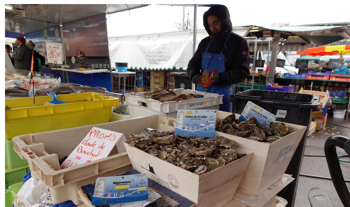
Les marchés locaux (local markets)