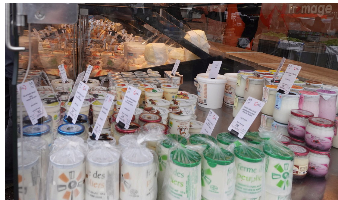
Des producteurs locaux