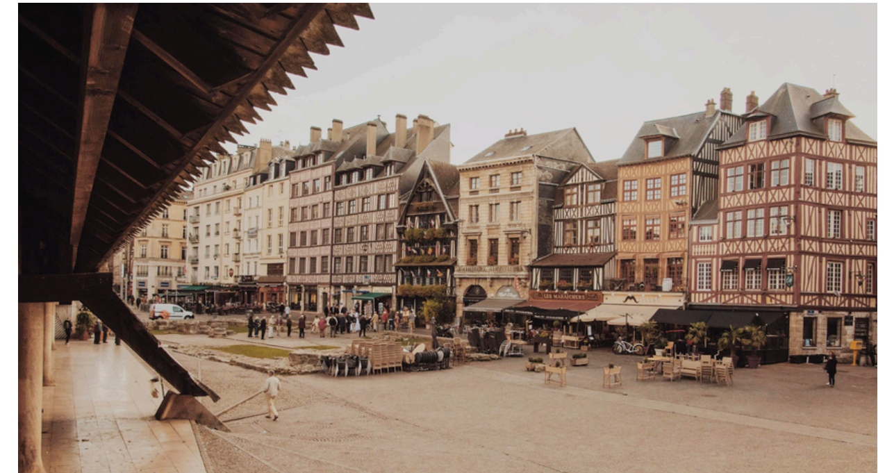
Historial Jeanne D'arc