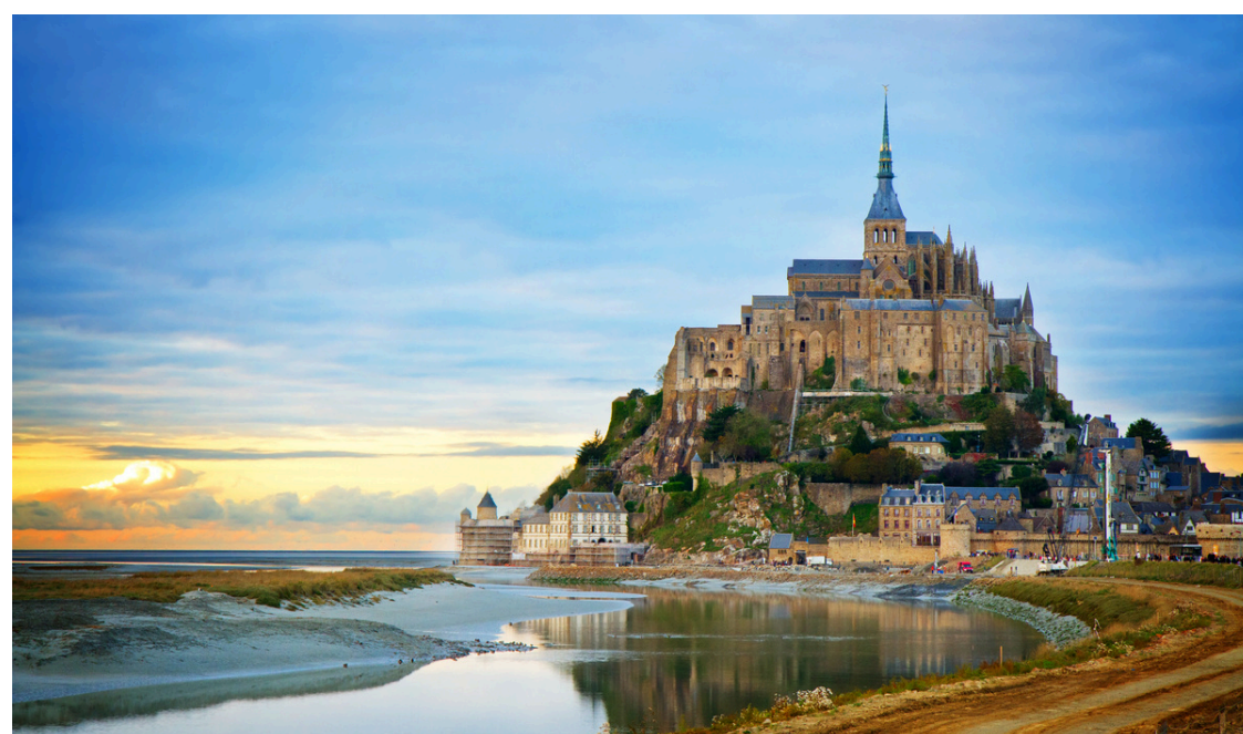
Le Mont St Michel