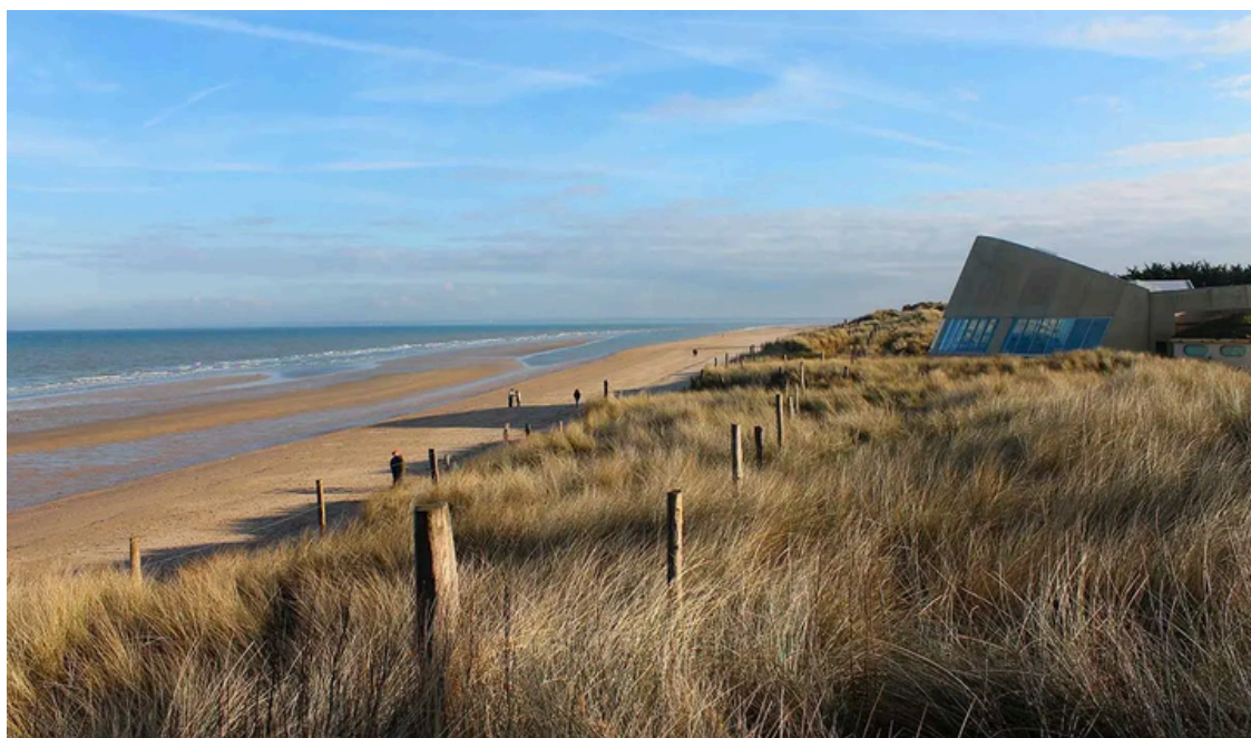
Les plages du débarquement(landing beaches)