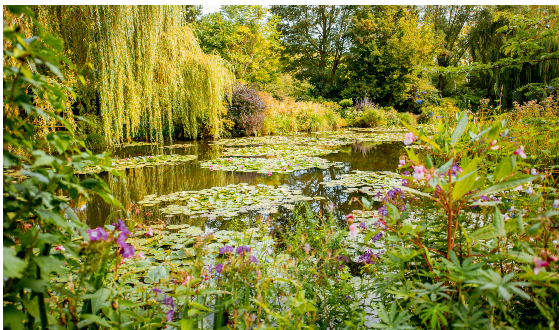
La maison et jardin de Claude Monet