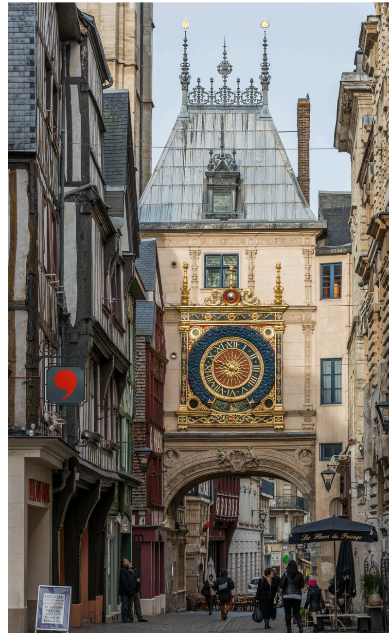
Le Gros - Horloge